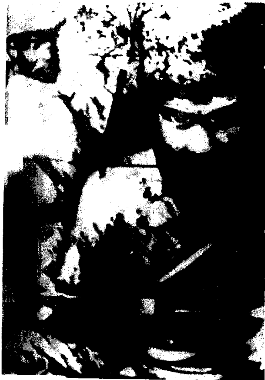
Вълчан войвода и Кара Кольо